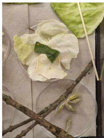
Vlinders in groep 3

De lente is begonnen. Het is de tijd van een nieuw begin, bezinning, vasten en vieren. Op school zien we dit terug in o.a. de rupsen die ontpoppen tot vlinders, besteden we aandacht aan de Ramadan en staan we stil bij Pasen. Het lange Paasweekend staat voor de deur met hopelijk temperaturen die de mini vakantie extra feestelijk maken. Wellicht een idee om de Dichters in de Dop speurtocht te lopen!